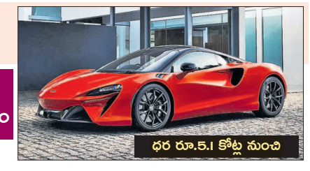
ధర రూ.5.1 కోట్ల నుంచి

దిల్లీ: బ్రిటన్ కు చెందిన విలాసవంత కార్ తయారీ సంస్థ మెక్ లారెన్ ఆటోమోటివ్, తన హైటెక్ స్పోర్ట్స్ కారు ఆర్మారాను మన దేశంలోకి ప్రవేశ పెట్టింది. దీని ధర రూ.5.1 కోట్లు (ఎక్స్ షోరూం) నుంచి ప్రారంభమవుతుంది. ఈ కార్లను బ్రిటన్ నుంచే దిగుమతి చేయనుంది. వినియోగదార్ల అభిరుచికి తగ్గట్టు కారులో మార్పులు చేస్తామని, ఆ మేరకు ధర మారుతుందని కంపెనీ తెలిపింది. గరిష్ట వేగం గంటకు 390 కి.మీ.. కేవలం 3 సెకన్లలో గంటకు 100 కి.మీ. వేగాన్ని, 8.8 సెకన్లలో 200 కి.మీ. వేగాన్ని ఈ కారు అందుకుంటుందని సంస్థ తెలిపింది. 2,993 సీసీ ట్యూన్డ్ టర్బోచార్జ్డ్ వీగ్ పెట్రోల్ ఇంజిన్ తో వస్తున్న ఈ మోడల్లో 8-స్పీడ్ ట్రాన్స్మిషన్, లిథియం-అయాన్ బ్యాటరీ ప్యాక్ కారణంగా అపూర్వపు ట్యాంక్, మెరుగైన డ్రైటింగ్ సృందం కనిపిస్తుంది. మొత్తం మీద 680 సీఎస్, 720 ఎస్ఎమ్ టూర్స్ను ఈ ప్యాకేజీ అందిస్తుంది.